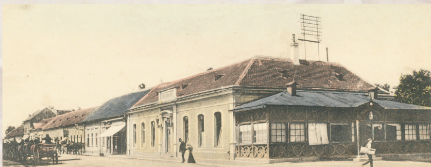
Tata, Rákóczi utca

A történelmi egyházak segítségével, támogatása nélkül nem kerülhetne sor a rendezvény megvalósítására, aminek élő hitéleti-történelmi gyökereit is erősíti, hogy 2013-re már erdélyi lelkipászorok is jelezték részvételüket a programban.